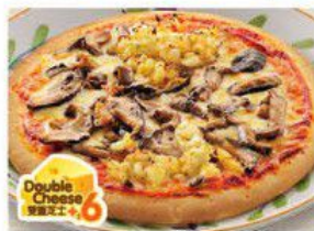
Cottage Pizza 農舍薄餅 $30