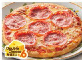
Salami Pizza 莎樂美腸薄餅 $34