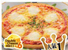
Pizza "MARGHERITA" 水牛芝士薄餅 $30