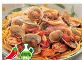
Spaghetti "VONGOLE" 邦哥尼意大利粉 $32