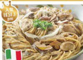
Spaghetti with Black Truffle Sauce 黑松露野菌忌廉意大利粉 $35