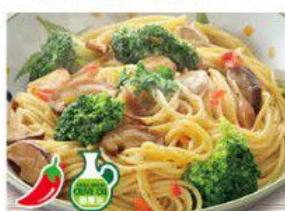
Spaghetti "PEPERONCINO" with Broccoli 野菌西蘭花香蒜辣汁意大利粉 $32