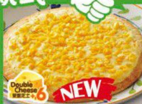
Pizza with Sweet Corn and White Sauce 白汁黃金粟米薄餅 $30