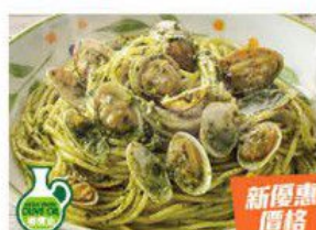
Spaghetti "Pesto alla Genovese" with Clam 青醬蜆肉意大利粉 $32