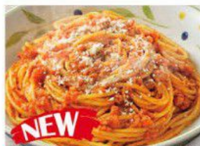
Spaghetti Bolognese 肉醬意大利粉 $29