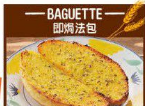
Garlic Baguette 蒜香法包 $10