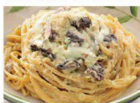
Spaghetti with Mushroom & Cream 野菌忌廉意大利粉 $29