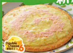
Pizza with "TARAKO" and white sauce 明太子白汁薄餅 $34