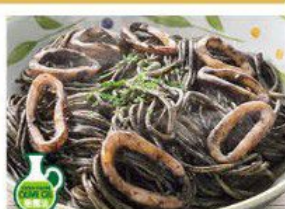
Spaghetti "NERO DI SEPIA" 墨魚汁意大利粉 $32