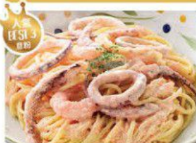
Spaghetti with "TARAKO" sauce 明太子魷魚蝦仁意大利粉 $35