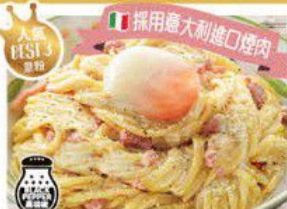
Spaghetti "CARBONARA" 溫泉蛋卡邦拿那意大利粉 $35