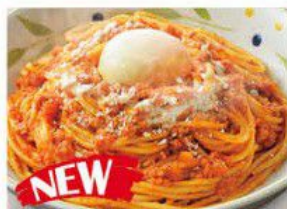
Spaghetti Bolognese with a Soft-boiled Egg 溫泉蛋肉醬意大利粉 $34