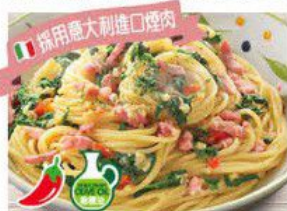
Spaghetti "PEPERONCINO" with Spinach 菠菜煙肉香蒜辣汁意大利粉 $29