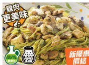
Spaghetti "Pesto alla Genovese" with Chicken and Mushroom 青醬雞肉野菌意大利粉 $32