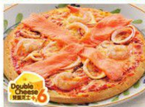
Seafood Pizza 地中海海鮮薄餅 $36