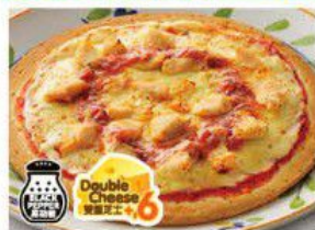
Pizza with Chicken and Black Pepper Sauce 黑椒汁雞肉薄餅 $36