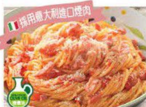
Spaghetti with Tomato & Bacon 蕃茄煙肉意大利粉 $29