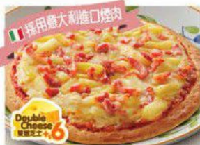
Pizza with Bacon & Pineapple 煙肉菠蘿薄餅 $30